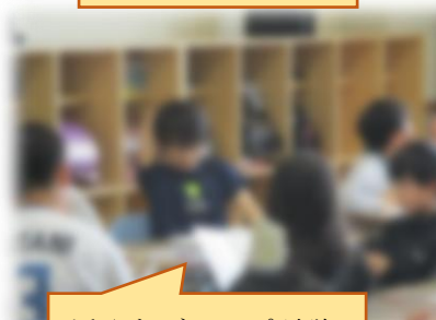
活発なグループ討議