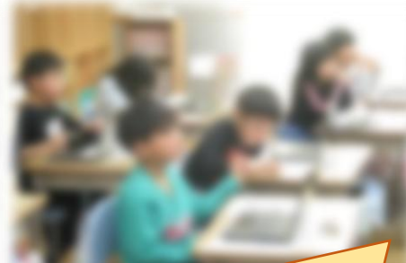
タブレットを活用した授業も開始