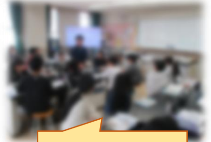
専科による授業も開始