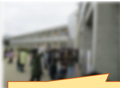
4/6 学級発表、6年生準備登校（一生懸命働いてくれました）

各学級・学年では、オリエンテーションや体制づくり等も終わった他、1年生も給食が開始され、平常の教育活動が進められるようになっていきます。