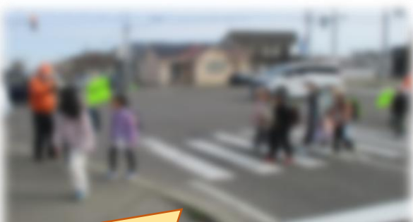
今年度も各種ボランティアの力をお借りして