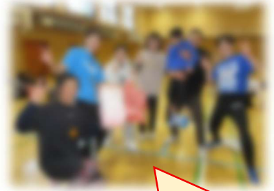
優勝した4年3組チーム