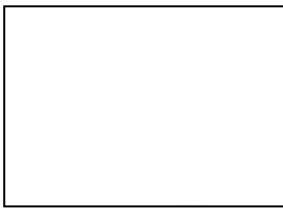
【児童会役員 及び 委員長】

朝学習の時間、リモートでしたが、全校児童が見守る中、令和6年度児童会役員及び各委員長に認証状を渡しました。