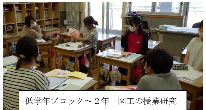
低学年ブロック～2年 図工の授業研究

以上のことを中心に進めていながら、子どもたちを育てていきます。もちろん、昨年度まで研究をしていた道徳科において、いろいろなもの見方や考え方、他者を思いやる心もしっかりと育てていきます。