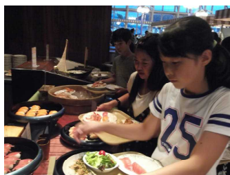
← 1日目を終え、ホテルでの夕食