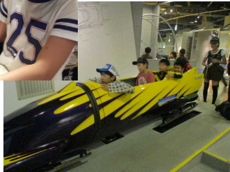
大倉山ウィンター → スポーツミュージアムでボブスレー体験