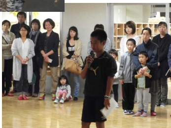
→ 無事学校に到着し、修学旅行終了。多くの皆様に出迎えていただきました。