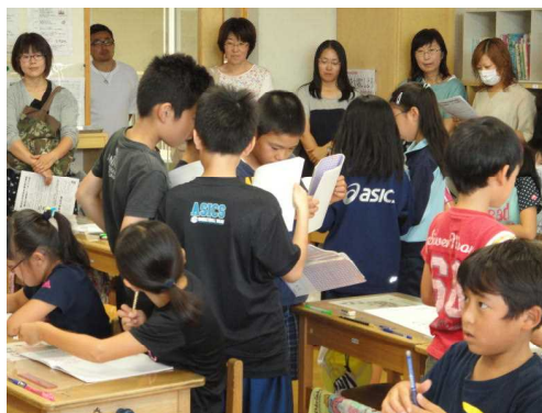
【どう考えた? 意見交流】

お忙しい中、ご参観いただき、貴重な感想をお聞かせいただきました皆様に感謝申し上げます。ありがとうございました。