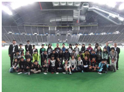
← 日ハム対楽天戦前の札幌ドームを見学。ストレッツをする選手も見かけました。